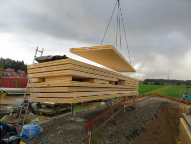
Anlieferung der CLT-Platten auf der Baustelle